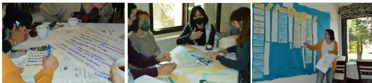
Εικόνα 3: Καταγραφή και συζήτηση προτάσεων και κατευθύνσεων διαχείρισης του τοπίου των Πρεσπών στο 2 ο συμμετοχικό εργαστήριο στον Λαιμό Πρεσπών

Τέλος έγινε η παρουσίαση των προτάσεων από την κάθε ομάδα και ακολούθησε συζήτηση.