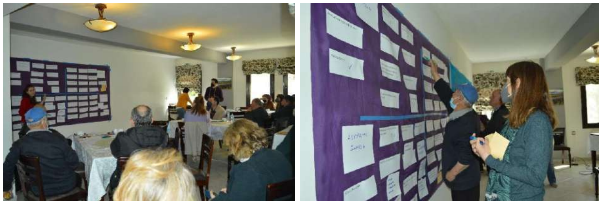
Εικόνα 2: Συζήτηση για τα δυνατά και αδύνατα σημεία, τις ευκαιρίες και τις προκλήσεις για το τοπίο των Πρεσπών στο 2 ο συμμετοχικό εργαστήριο στον Λαιμό Πρεσπών

συμπληρώσουν τα αρχικά αυτά σημεία και να βαθμολογήσουν ποια έχουν μεγαλύτερη βαρύτητα για το τοπίο της Πρέσπας.