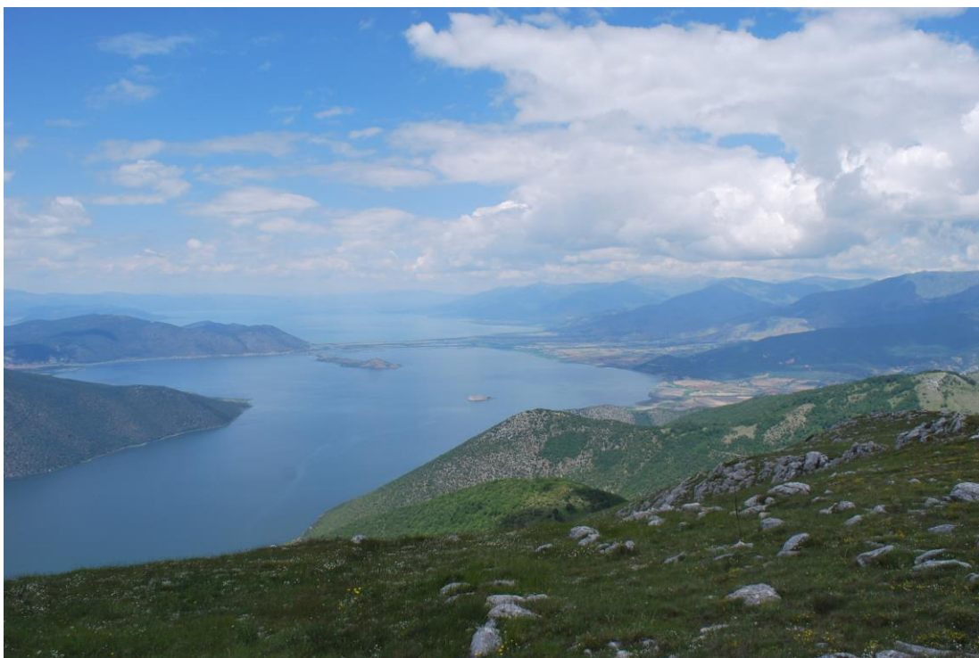
Εικόνα: Κορυφή όρους Σφήκα.

Η περιβαλλοντική οργάνωση Εταιρία Προστασίας Πρεσπών αναζητά δυο (2) συνεργάτες/ Βοτανικούς Πεδίου για έργο ορισμένου χρόνου (μέχρι 3 μήνες) που σχετίζεται με τη συλλογή χλωριδικών δεδομένων από την περιοχή του όρους Σφήκα (Τρικλάριο) κατά τη διάρκεια του Ιουνίου 2023. Η σύμβαση θα καλύπτει επτά ημέρες εργασιών πεδίου, αλλά και τον απαιτούμενο χρόνο για την αναγνώριση των φυτικών δειγμάτων.